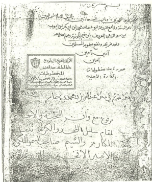
الصفحة الأولى من مخطوطة كتاب الهجرة وباب السعادات