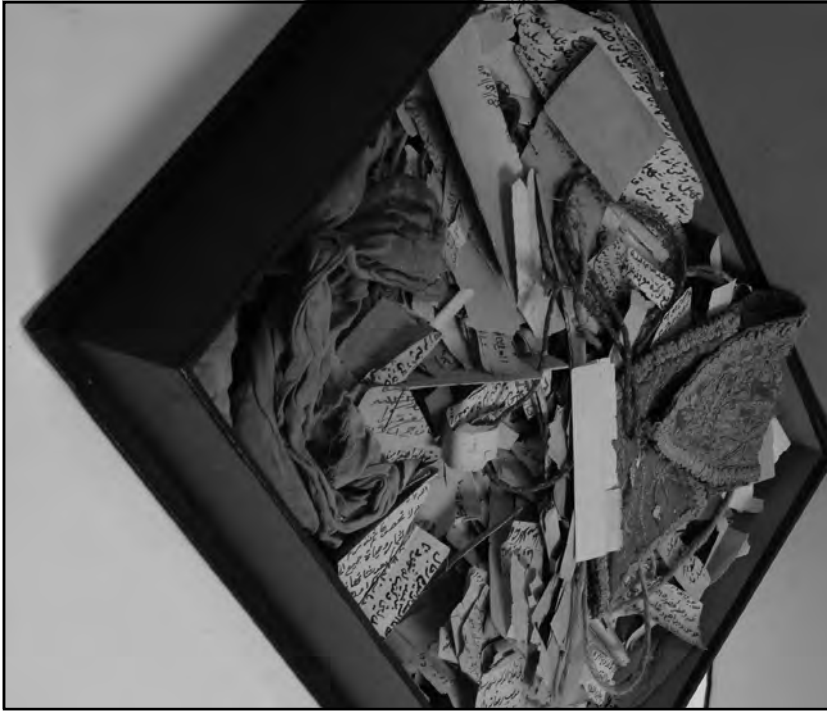
ملحق رقم (٢)