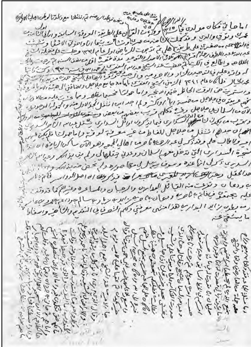
ملحق رقم (١)