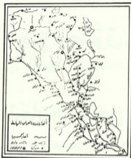
الخارطة رقم (٢) وهي منقولة عن كتاب داود باشا والي بغداد للدكتور عبدالعزيز سليمان نوار (أنظر ص ٣٦٩)