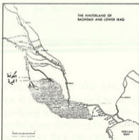
الخارطة رقم (٣) وهي منقولة عن كتاب JACOB LASSNER بعنوان SHAPING OF ABBASID RULE, PRINCETON, 1980