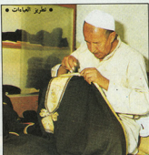
• تطريز العمامات •

جميع فنون التطريز والنقش والنحت والزخرفة الجسدية والصباغة والحداثة وصنع الفخار والأسلحة وغيرها، من أهم الحرف التقليدية ما يلي: