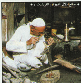
• صنع دلال القهوة (الفرنسيات) •