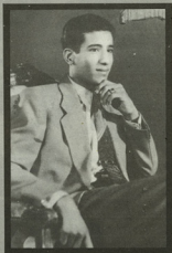
• صاحب السمو الملكي الأمير ، سلمان بن عبد العزيز ، أمير منطقة الرياض.