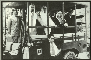
• الملك فهد بن عبد العزيز ، حفيظه الله ، وعلى يمينه سمو الأمير ، محمد بن عبد العزيز رحمه الله ، وعلى يساره الأستاذ حافظ وعيه ، وخلفهما الأستاذ خليل الرؤاف.