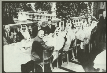
• الملك فهد ، حفيظه الله ، وعلى يمينه الأمير عبد الله الفيصل والأمير نواف ، والدكتور رشاد فرعون ، وعلى يساره الأستاذ خليل الرؤاف.