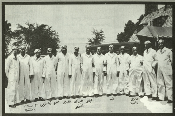
• في إحدى الدوائر العسكرية حضر الوفد السعودي وقد ارتدى ملابس رجال المدرعات .