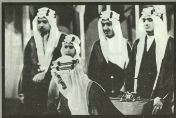
• الملك فيصل ، رحمه الله ، ووقف خلفه من اليمين كل من الملك فهد والأمير عبد الله الفيصل، والأمير نواف، والسيد علي رضا.