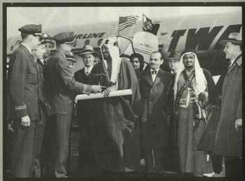
• الملك سعود بن عبد العزيز ، رحمه الله ، وخلفه الأستاذ خليل الروافد .