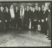
• الملك فيصل، والملك خالد ، رحمهما الله ، وخلفهما الأستاذ خليل الد