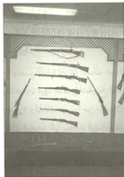
٢ - منظر لمجموعة من البنادق

كما يشاهد الزائر توسعة إضافية للقاعة التذكارية حيث أضيف لها بعض الأسلحة القديمة والمقتنيات التي كانت تستخدم في عهد الملك عبد العزيز بالإضافة إلى مجموعة نادرة من طوابع المملكة العربية السعودية منذ نشأتها حيث أشرف على هذه الإضافات أمين عام الدارة المكلف الدكتور طامي بن هديف البقمي بآرك الله جهوده في خدمة الدارة وأبلغها غاية ما يرجوه لها من النجاح .