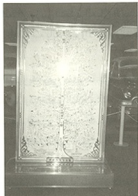
١ - شجرة آل سعود